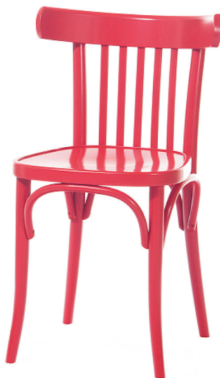
Stolička č. 763 (typická pre Slovensko)