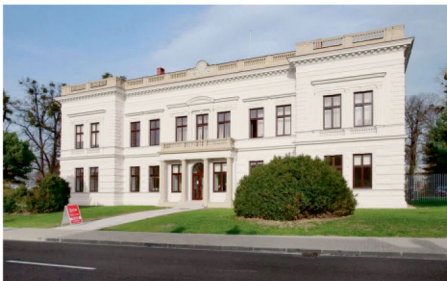
Vila Thonet (predajňa)