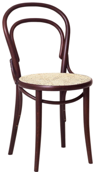
Stolička č. 14. (typická pre Česko)

Michal Thonet tu založil jednu zo svojich tovární pred viac ako 150-timi rokmi. Továreň firmy TON a.s. je jedno z prvých miest, na ktorých sa vyrábala ikonická kaviarenská stolička číslo 14. Naším hlavným cieľom bolo vidieť ich dlho zaužívané spôsoby ohýbania. Zároveň nám predstavili aj svoje moderné CNC technológie, povrchovú úpravu a dostali sme sa až do múzea/predajne, kde sme sa mohli zoznámiť s dôležitou časťou ich produktového portfólia.